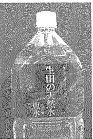
水道局が販売している「生田の天然水 恵水(めぐみ)」多摩区では民家園等4か所で売っています。

電気代がほとんどかかりません。相模湖から取った水はこれだけ処理が終わりますが、水がもつと汚いと、活性炭を入れて臭いや汚染物質を取り除いたり、もつといろいろな薬品を入れて高度処理をしなければいけません。この高度処理には莫大なコストがかかるというわれ、他都市ではそのために大幅な料金値上げもあつたそうです。企業団の水は、酒匂川や相模川の下流が原水のため、飲料水の受け入れにはこの懸念が生じます。 いっぽう、水がもつときれいであれば処理の過程が減ります。それが生田浄水場です。地下水を井戸から取っている生田の水は、泥がまじっていないので、沈殿池がいらず、ろ過池だけあればいいのです。地下水はミネラル分もあり、川崎市では簡単なる過だけしてペットボトルで売っているほどです。多摩区の水はおいしいといわれている川崎の水の中でも、もつとおいしい水なのです。