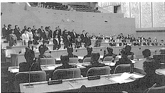
意見書採択に賛成の起立をする共産(左)民主、無所属議員

しました。議会最終日、本会議場で採決が行われましたが、自民党、公明党、神奈川ネットワーク運動の各会派が理由も述べず反対したため、賛成29、反対33で否決されてしまいました。