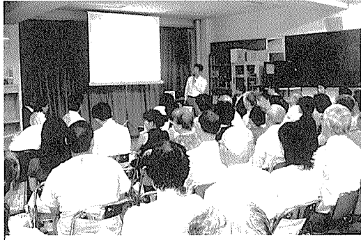
住民説明会には百名近い人が参加。関心の高さを示しました。