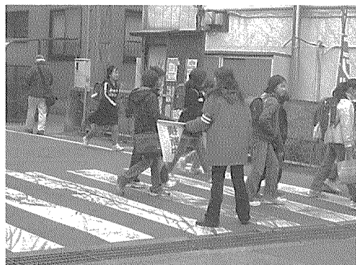
毎朝、子どもたちを安全に誘導する地域交通安全員さん