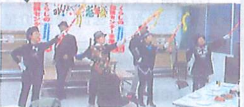
〈そうだんフォービューティーズ&ダンディーズ〉 〈前出さんピアノ伴奏〉